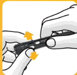
Duw het hendeltje één keer van voor naar achter.