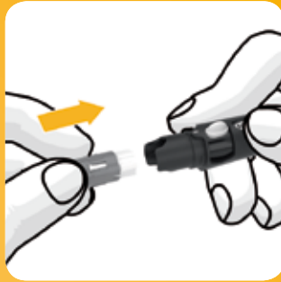
Plaats een lancettenhouder.