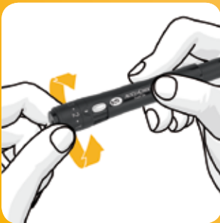
Kies de aangepaste prikdiepte.