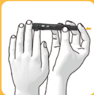
Aanspannen en prikken met slechts 1 klik.