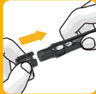
Plaats het beschermkapje terug.